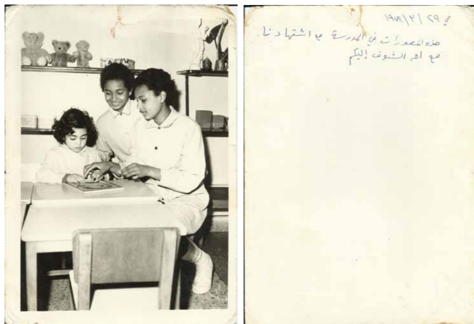
Saint Coeur, Beit Chabab (March 1974), courtesy of Nada El Sheikh, for the Mixed Feelings project.

In its first phase, “Mixed Feelings” toured 6 locations from the south (Sour) – as earlier waves of migration to West Africa originated from south Lebanon – to the north (Tripoli) of Lebanon, in collaboration with universities as well as municipalities.